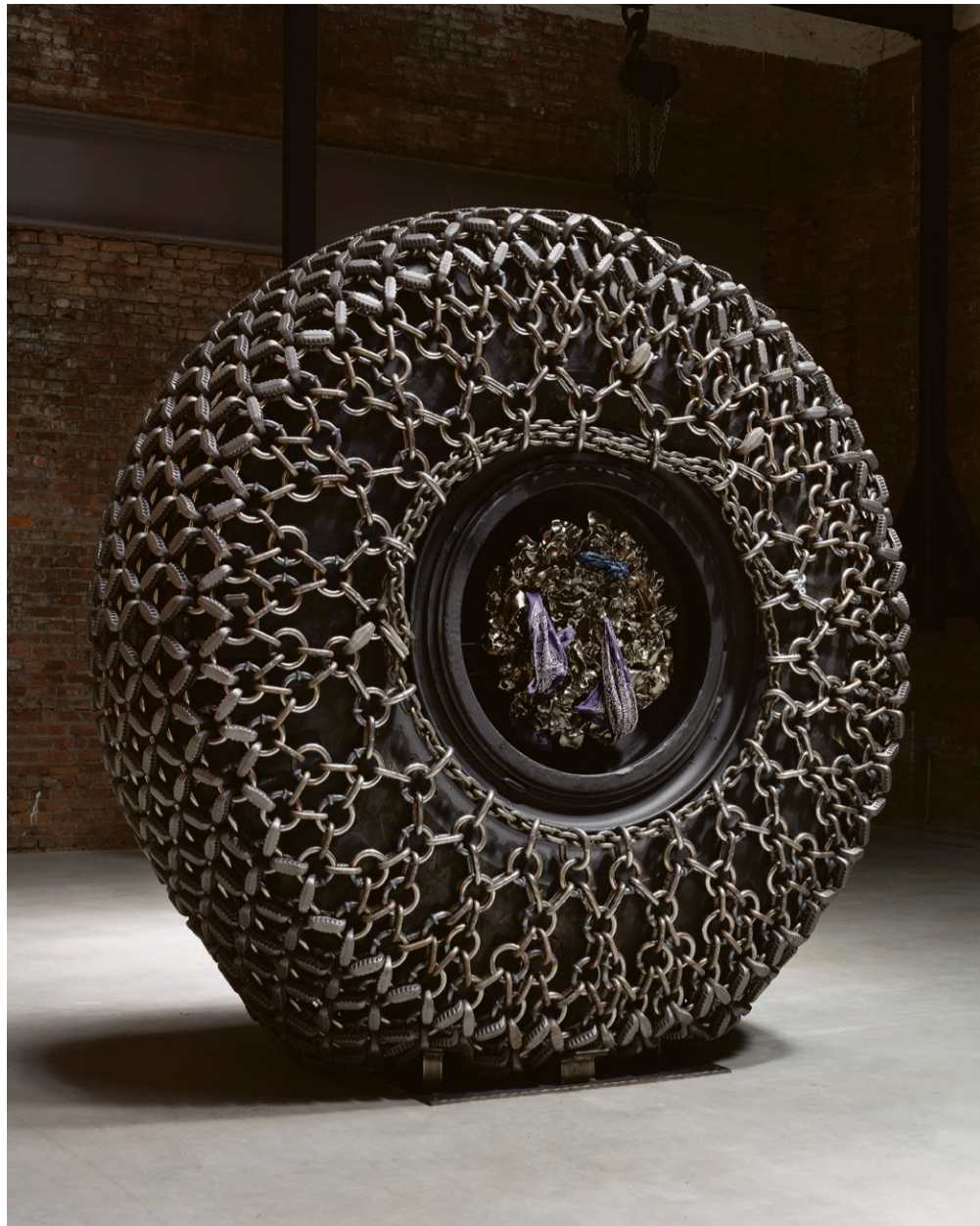
Jafas Big Wheel II, 2018. 242 x 240 x 104 cm. Hjulet er skræmmende i sin størrelse og brutalitet. Der er lidelse i værket, men også et æstetisk løft.

Jeg har dette til trods for et par år siden ret traditionelt valgt at plante en almindelig magnolie her i den lerede, kalkrige have. Planten er knap en meter høj og endnu for ung til at blomstre, men det kommer den forhåbentlig til i løbet af få år.